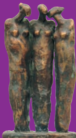
beeld: Tjikkie Kreuger