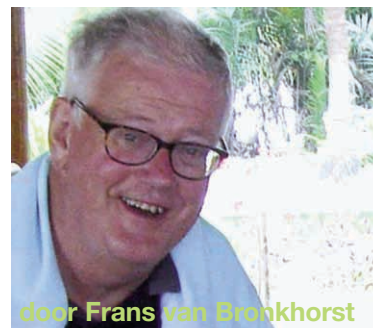
door Frans van Brankhorst

Ook dit jaar mochten De Vrienden even bij een deel van een van de vele repetities van de musical 'Pippin' van Theaterplan aanwezig zijn. Na de ontvangst in de Anish Kapoor-bar van het Parktheater konden we in optocht even inbreken in de Philipszaal. Daar was de repetitie in volle gang en ieder zocht in stilte en in het duister een plekje op.