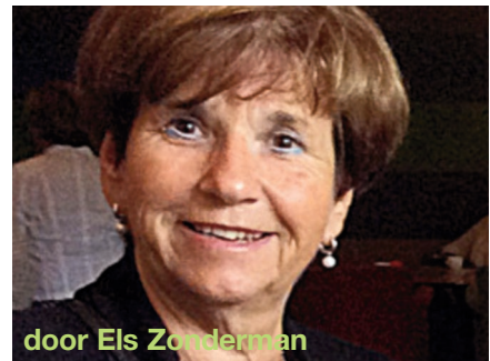
door Els Zonderman

Oscar laat ons deze avond beseffen, dat luisteren bestaat uit belangstelling tonen, iemand de ruimte geven door zijn of haar verhaal te laten doen, te laten merken dat je luistert, vragen stelt en feedback geeft. Deze thema's verwerkt hij in zijn workshops voor jongeren om interview- en luistertechnieken te helpen verbeteren. Door zijn enthousiasme, openheid en