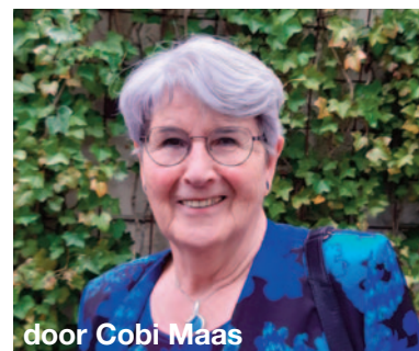
door Cobi Maas

van zijn dochter wilde hij dichterbij huis zijn. Rob komt over als een zeer betrokken persoonlijkheid. Zijn werk 'raakt', vertelt Rob en daar bedoelt hij mee dat door zijn werk goed te doen, hij zich zeer verbonden voelt met het publiek.