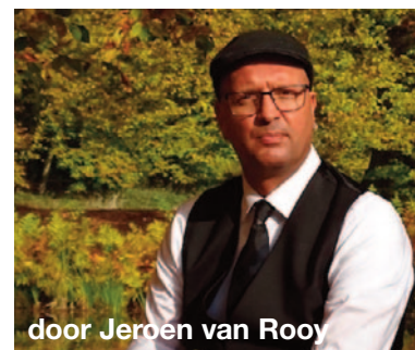
door Jeroen van Rooy

Want zo'n kijkje is natuurlijk leuk voor ons en goed als ondersteuning voor de jongeren in de aanloop naar de echte voorstellingen die plaats vonden begin januari (elk jaar is dat weer zo).